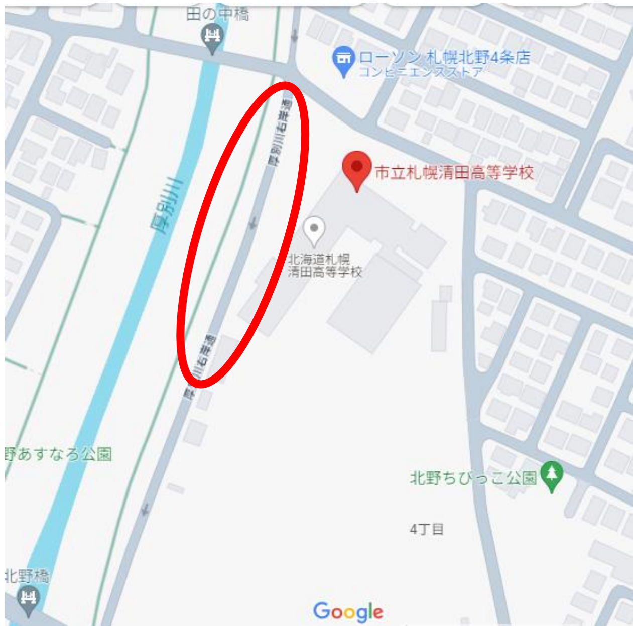
地下鉄よりバス乗り換え